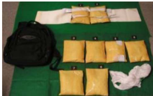
隠匿されていた覚醒剤