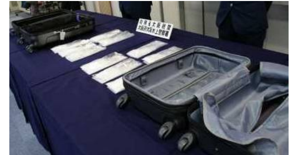
覚醒剤が隠匿されていたスーツケース

中華人民共和国から到着した日本人フェリー旅客から、覚醒剤約 2kg を摘発しました。覚醒剤はスーツケースの内張り内に隠匿されていました。