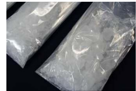
隠匿されていた覚醒剤