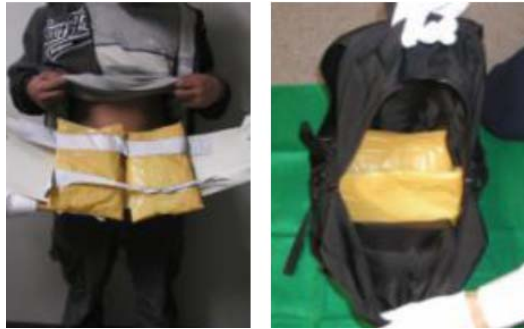
覚醒剤が隠匿されていた状況

停泊中の外国籍船舶から降り立った船舶乗組員から、覚醒剤約 6kg を摘発しました。覚醒剤は、リュックサック内及び腹部に巻き付けられて隠匿されていました。