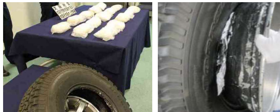
覚醒剤が隠匿されていたスペアタイヤ

カナダから到着した海上コンテナ貨物から、覚醒剤約15kgを摘発しました。覚醒剤は、自動車のスペアタイヤの中に隠匿されていました。