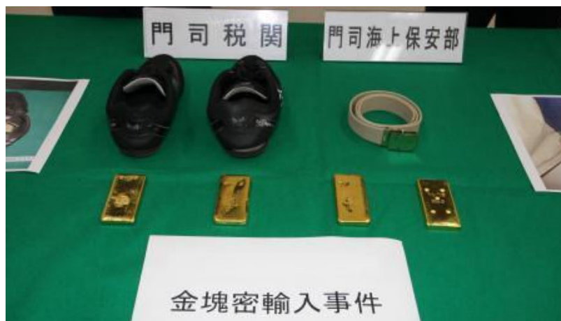
運動靴内や身辺に巻き付けたベルトに貼り付けて隠匿

大韓民国から入港した外国貿易船の乗組員から、金塊4塊(約4kg)を摘発しました。金塊は、船員が履いていた運動靴内や身辺に巻き付けたベルトに貼り付けて隠匿されていました。