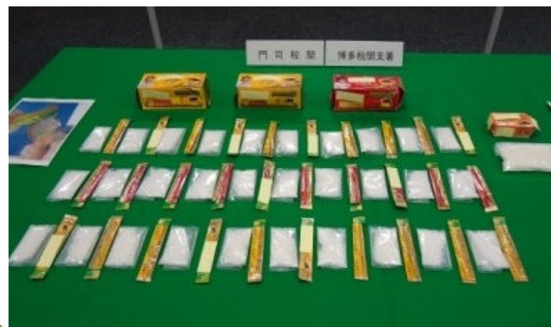
隠匿されていた覚醒剤

大韓民国から到着した定期高速船旅客から、覚醒剤約1kgを摘発しました。覚醒剤は、インスタントコーヒーのスティック計60本や石鹸の紙箱内に隠匿されていました。