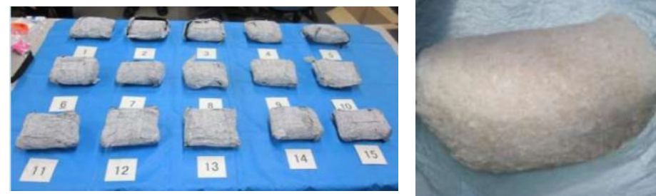
隠匿されていた覚醒剤