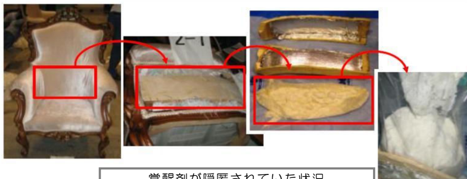
覚醒剤が隠匿されていた状況