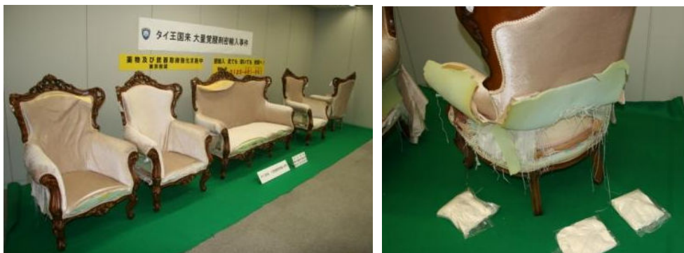
覚醒剤が隠匿されていた椅子及び長椅子

タイ王国から到着した別送品貨物から、覚醒剤約17kgを摘発しました。覚醒剤は、椅子及び長椅子の内部に隠匿されていました。