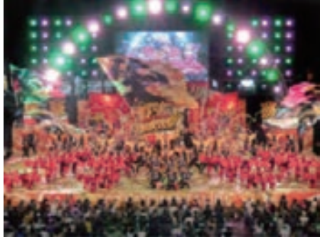
にっぽんど真ん中祭り×大阪・関西万博 8/2~3