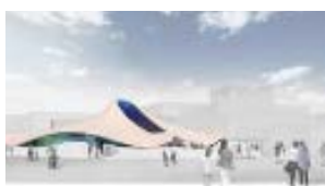
いのち動的平衡館