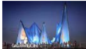
ガスパビリオン おぼけワンダーランド