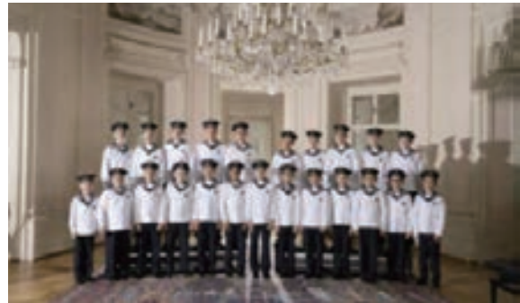
ウィーン少年合唱団コンサート 5/23

大阪・関西万博に関する関係者会合資料（2025年日本国際博覧会協会資料、各機関HP）から引用