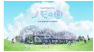
パナソニックグループ パビリオン ノモの国