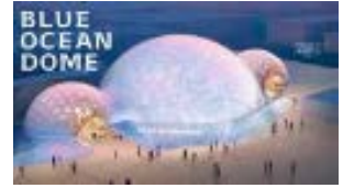
BLUE OCEAN DOME