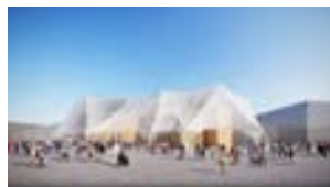
大阪ヘルスケアパビリオン