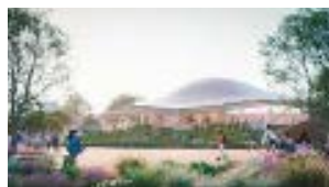
いのちの遊び場クラゲ館