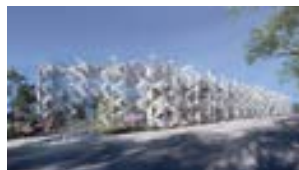
ウーマンズパビリオン