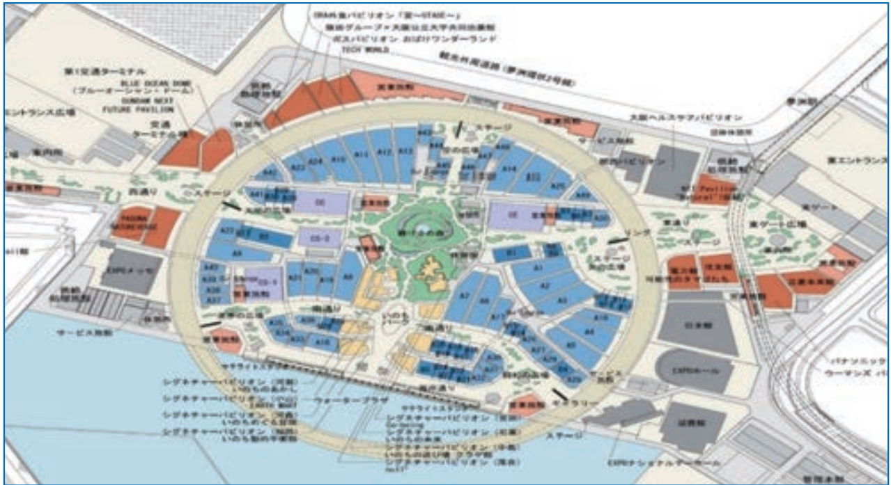
2025年日本国際博覧会協会 理事会資料から引用