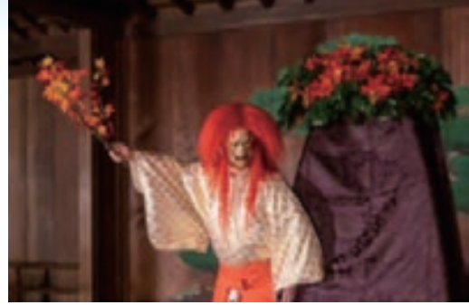
未来に繋ぐ、能楽の世界 7/13~14