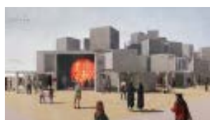
いのちめぐる冒険