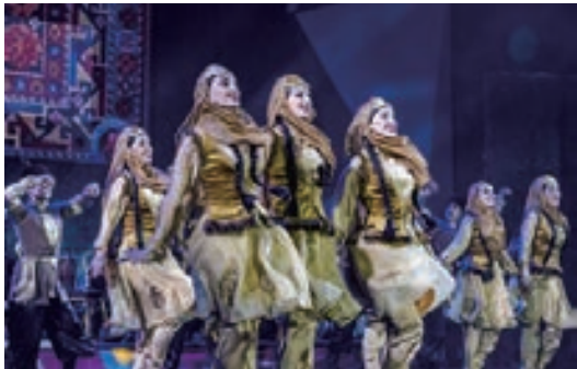
アゼルバイジャン 命をつなぐ 6/5