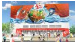
飯田G×大阪公立大学 共同出資館