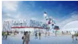
GUNDAM NEXT FUTURE