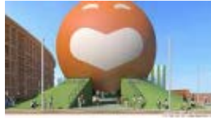
よしもと waraii myraii館