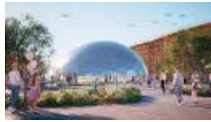
電力館 可能性のタマゴたち